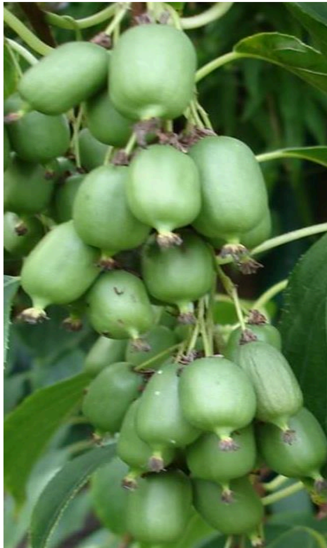
Рис. 5.1. Використання плодоносних рослин актинідії в озелененні.

Виходячи з результатів проведених досліджень, що стосуються росту і розвитку сортів актинідії в умовах інтродукції, що мають високі декоративні властивості, ми маємо підстави рекомендувати їх для використання в озелененні населених місць (рис. 5.1–5.3).