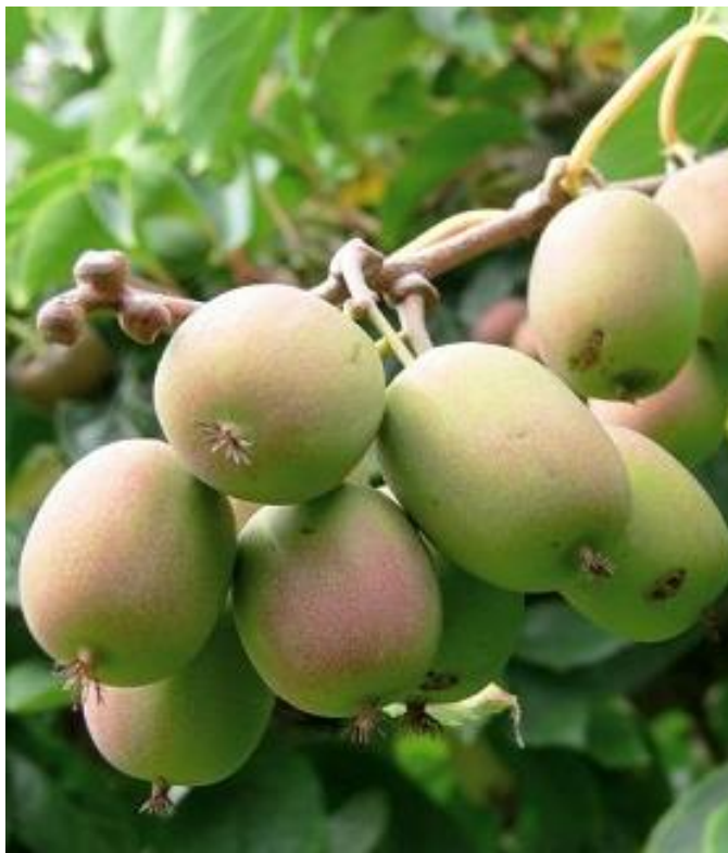
Рис. 2.1. Плоди актинідії сорту Самоплідна

Найкращими для вирощування актинідії є пухкі і суглинкові ґрунти з рН 5,5-6,0. При механізованій обробці міжрядь, рослини цього сорту актинідії краще висаджувати з відстанню в міжряддях 3–4 м, а між рослинами 2 м. Розмір посадкової ями становить 60х60 см. У кожен садивну яму, під час висаджування рослин вносять 10–12 кг гною, 100–200 суперфосфату. Після висаджування рослини поливають водою, а приштамбову відстань мульчують торфом, опалим листям, тирсою та ін. Добрива в наступні роки вегетації необхідно вносити восени під час перекопування. При цьому треба враховувати, що коренева система рослини розміщується поверхнево, тому під рослинами належить проводити рихлення на глибину 10–12 см. У розрахунку на 1 м 2 вносять 2,5 кг гною, 20–30 г аміачної селітри, 40–50 г суперфосфату і 10–15 г калійної солі. За вирощування рослин актинідії важливе значення має правильне формування пагонів. Для підтримки пагонів найкраще використовувати Т-образні опори, до яких підв'язують рослини так, щоб пагони були рівномірно розподілені по шпалері.