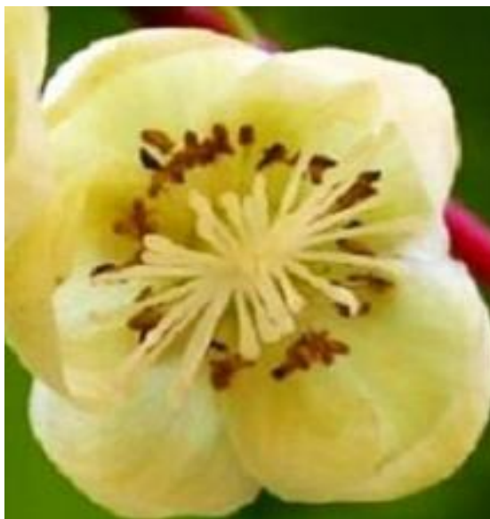
Рис. 2.2. Квітка рослини сорту Adam (чоловіча форма актинідії коломікта)

«Адам» ( Adam ) — чоловіча форма актинідії коломікта. Деревна, високоросла, декоративна листопадна ліана, відноситься до родини Актинідієвих. Рослина досить зимостійка, тіньовитривала, світлолюбна, вологолюбна, стійка до хвороб і шкідників, заввишки до 4,0 м, відрізняється красивими декоративними листками. біло-зеленого забарвлення які потім стають блідо-зелено-рожевими. Квітки невеликі за розміром забрані в суцвіття по 3–5 шт., білі, мають тільки тичинки без приймочки маточки з ароматом лимону. У центрі квітки ледь помітна укорочена зав'язь, яка оточена численними (до 80 шт.) тичинками (рис. 2.2).