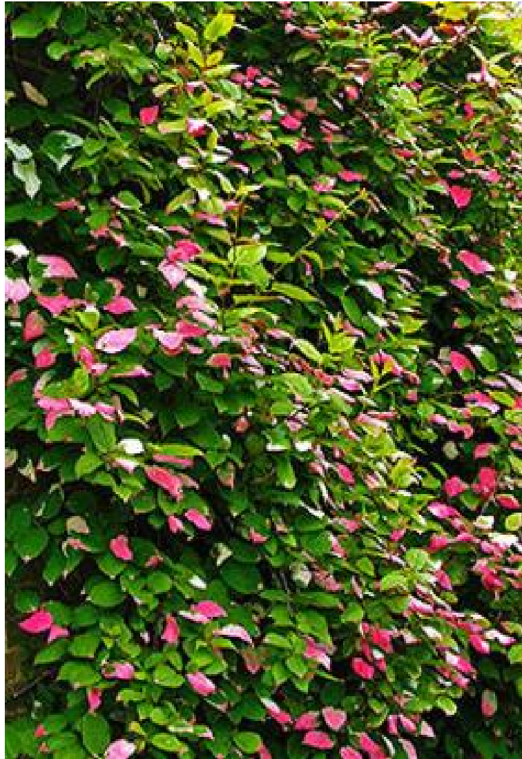
рис. 5.3. Розростання пагонів у рослини актинідії в інтер'єрі.

вирощування садивного матеріалу згідно рекомендацій, отриманих на основі результатів наукових досліджень.