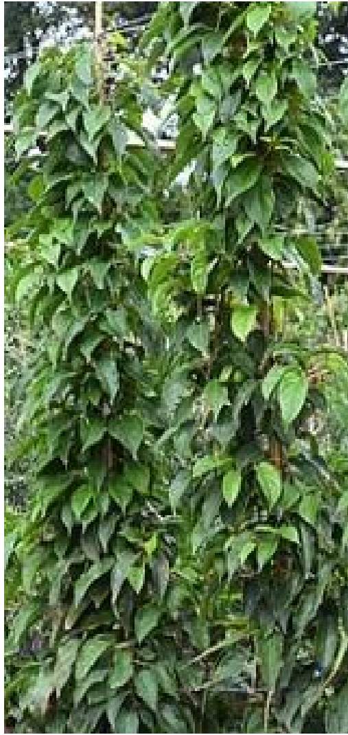
Рис. 5.2. Використання поодиноких рослин актинідії в озелененні.