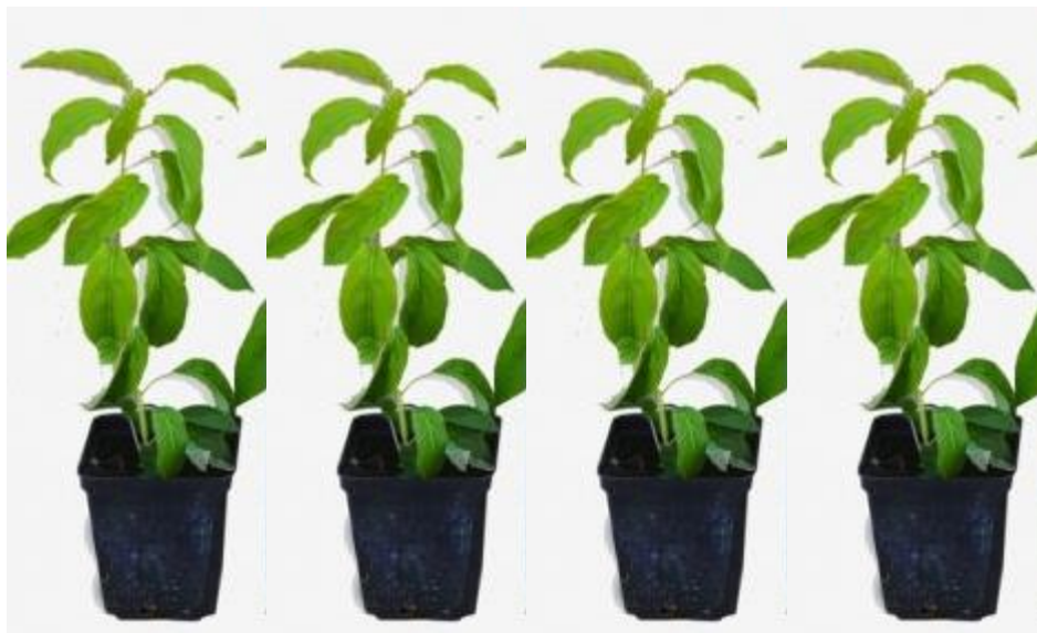
Рис. 2.3. Однорічні рослини сорту Дон Жуан (чоловіча форма) в контейнерах перед висаджуванням.

Дон Жуан (чоловіча форма) універсальний запилювач більшості сортів актинідії, який здатний ефективно запилити 5–6 жіночих рослин. Має високі декоративні якості, що надають рослинам привабливості своїми квітами в період цвітіння, формою та забарвленням листків. Швидкоросла рослина з щорічним приростом 2–3 м, заввишки до 5–6 м., садивний матеріал вирощують в контейнерах (рис. 2.3).